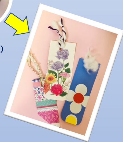
しおりをつくるよ